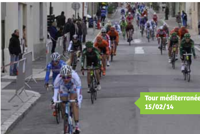
Tour méditerranéen 15/02/14