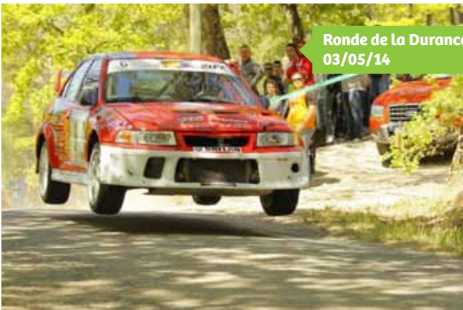
Ronde de la Durance 03/05/14