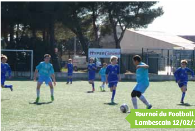
Tournoi du Football Club Lambescain 12/02/14