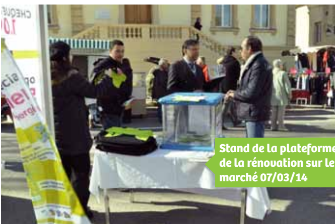
Stand de la plateforme de la rénovation sur le marché 07/03/14