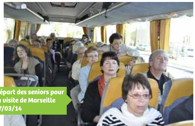
Départ des seniors pour la visite de Marseille 17/03/14