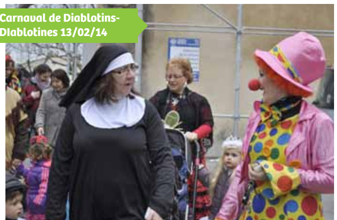
Carnaval de Diablotins-Diabloines 13/02/14