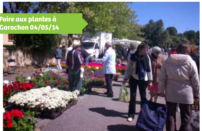
Foire aux plantes à Garachon 04/05/14