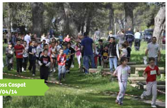
Cross Caspat 12/04/14