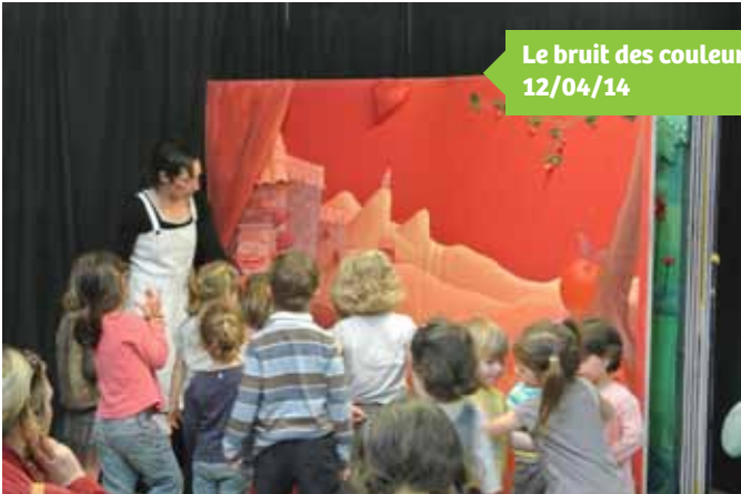
Le bruit des couleurs 12/04/14