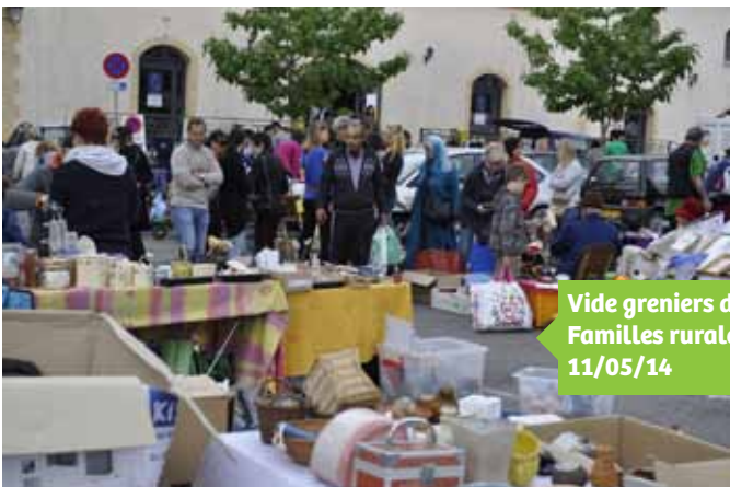
Vide greniers de Familles rurales 11/05/14