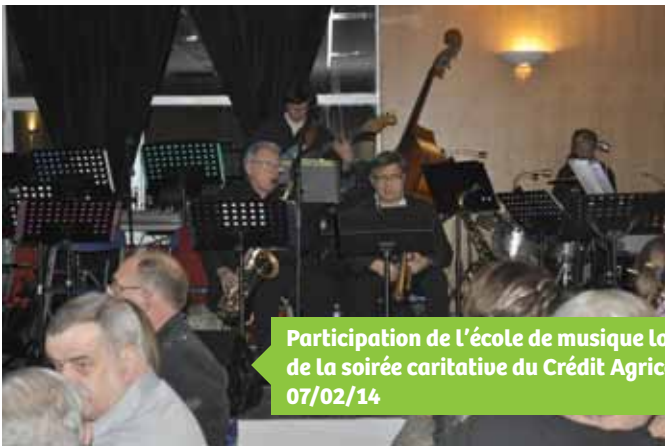
Participation de l'école de musique lors de la soirée caritative du Crédit Agricole 07/02/14