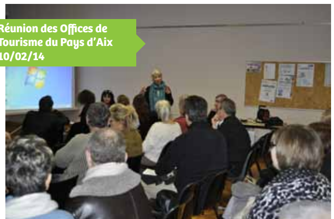
Réunion des Offices de Tourisme du Pays d'Aix 10/02/14