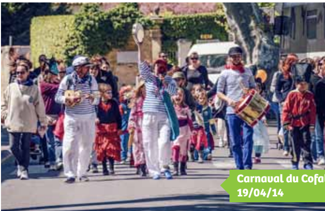
Carnaval du Cofals 19/04/14