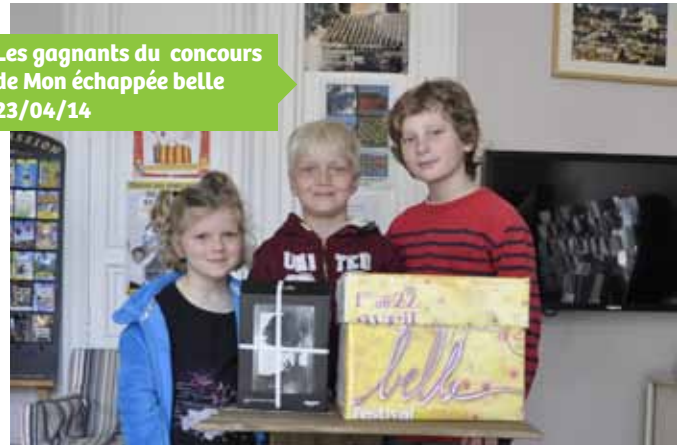
Les gagnants du concours de Mon échappée belle 23/04/14