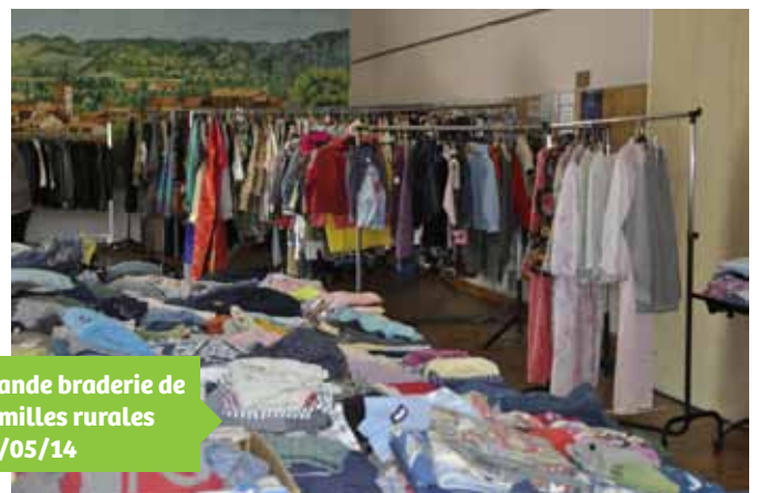
Grande braderie de Familles rurales 09/05/14