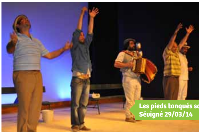
Les pieds tanqués salle Séuigné 29/03/14