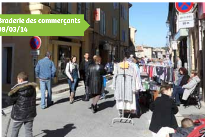
Braderie des commerçants 08/03/14