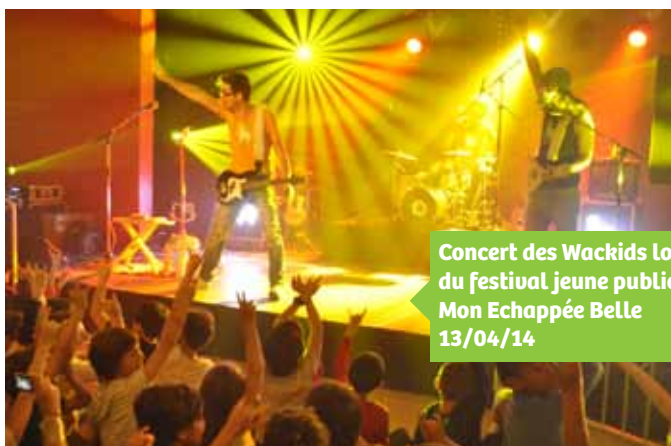
Concert des Wackids lors du festival jeune public Mon Echappée Belle 13/04/14