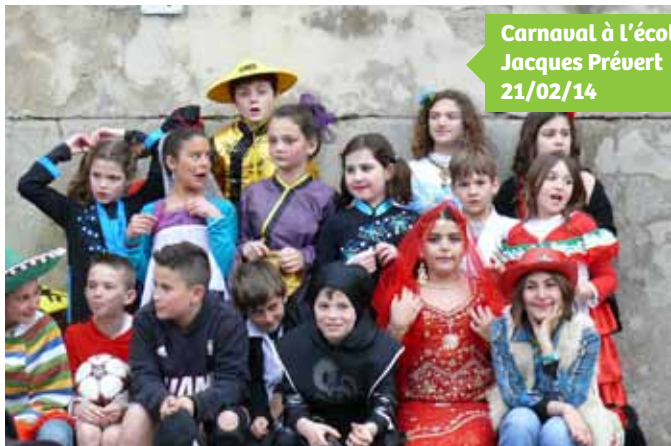
Carnaval à l'école Jacques Prévert 21/02/14