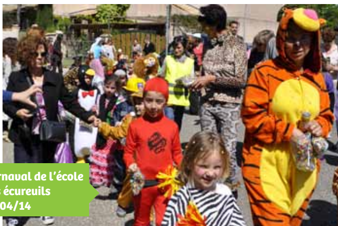
Carnaval de l'école des écureuils 17/04/14