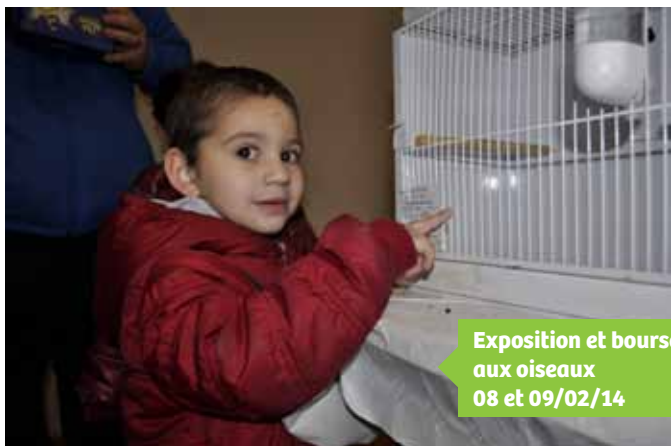
Exposition et bourse aux oiseaux 08 et 09/02/14