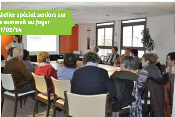
Atelier spécial seniors sur le sommeil au foyer 17/02/14