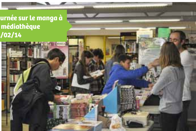
Journée sur le manga à la médiathèque 21/02/14