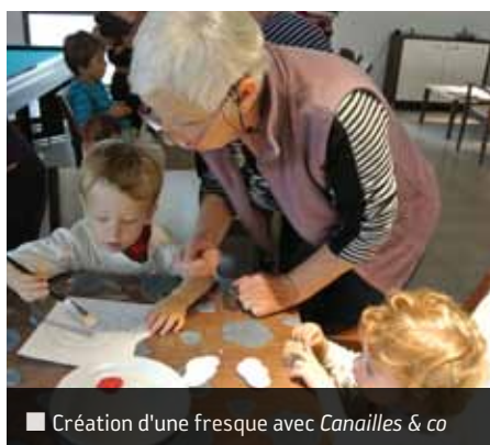
■ Création d'une fresque avec Canailles & co