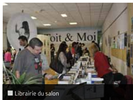
■ Librairie du salon