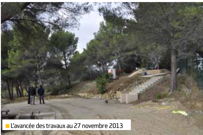
■ L'avancée des travaux au 27 novembre 2013

Le site est constitué de deux espaces séparés par un petit escalier (le premier de 200 m 2 , le second de 100 m 2 environ). Le carré confessionnel est facilement accessible au nord du cimetière et dispose d'accès PMR, pour un lieu de culte enfin à la disposition de tous les Lambescains.