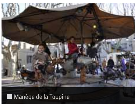
■ Manège de la Toupine