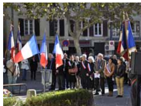
■ 11 novembre Commémoration du 11 novembre 1918