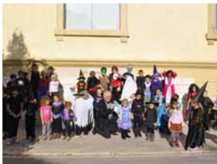
■ 26 octobre - Fête des sorcières