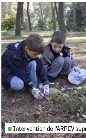
■ Intervention de l'ARPCV auprès des enfants de l'ALSH - 6 novembre

L'Association pour le Reboisement et la Protection du Cengle Sainte-Victoire œuvre depuis 27 ans à la protection des forêts et mène un travail important sur les reboisements en feuillus d'essences exclusivement locales. Ses expérimentations en reboisement se basent sur des études de la forêt méditerranéenne depuis 6 000 ans. Elle a ainsi planté plus de 120 000 arbres sur Sainte-Victoire et ses alentours.