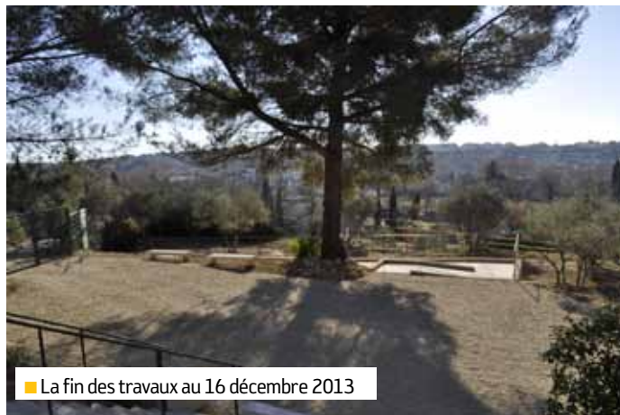
■ La fin des travaux au 16 décembre 2013