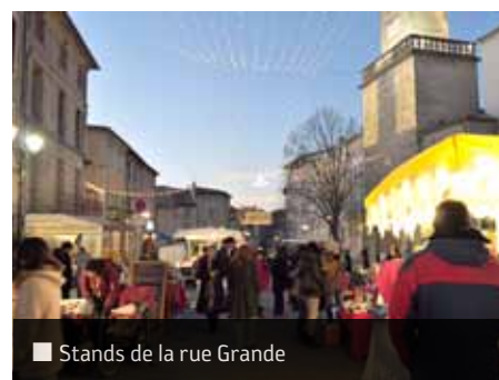
■ Stands de la rue Grande