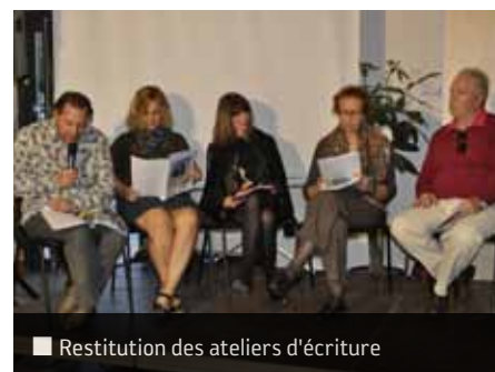
■ Restitution des ateliers d'écriture