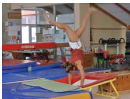
■ 22 octobre Stage de gym des vacances de la Toussaint