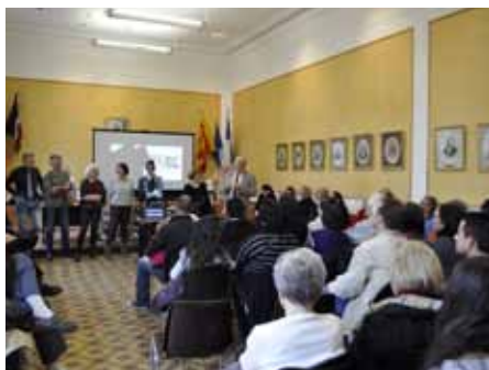
■ 23 novembre - Accueil des nouveaux arrivants à Lambesc