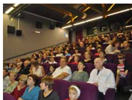
■ 25 octobre - Inauguration du cinéma numérique à la Salle Sévigné