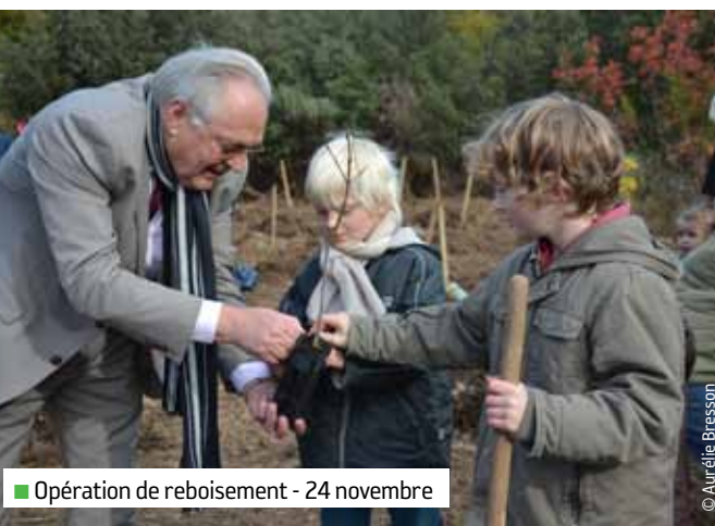
■ Opération de reboisement - 24 novembre