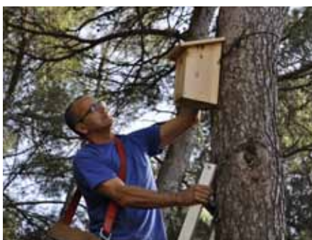
■ 28 octobre - Pose de niochis à mésanges pour lutter contre les chenilles processionnaires