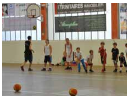
■ 22 octobre Stage de basket des vacances de la Toussaint