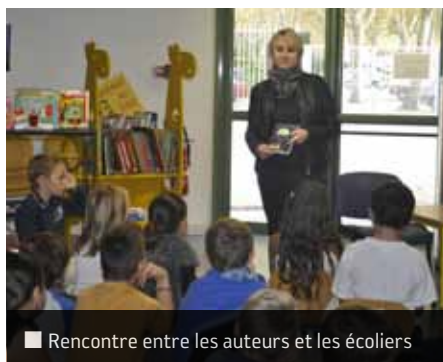
■ Rencontre entre les auteurs et les écoliers