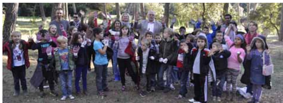
■ 6 novembre 2013 - Animation pour l'ALSH par l'ARPCV (Association pour le reboisement et la protection du Cengle Sainte-Victoire)