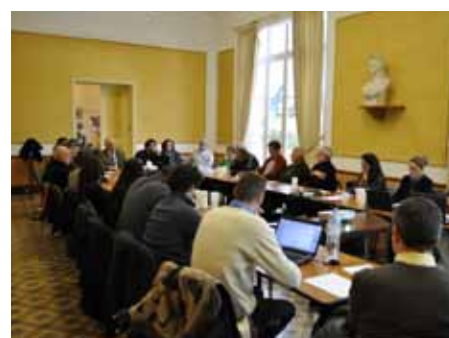
■ 15 novembre - Réunion AGIR en Mairie