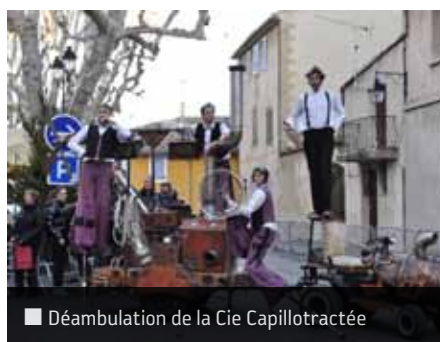
■ Déambulation de la Cie Capillotractée