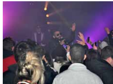
■ 29 novembre Concert de Némir