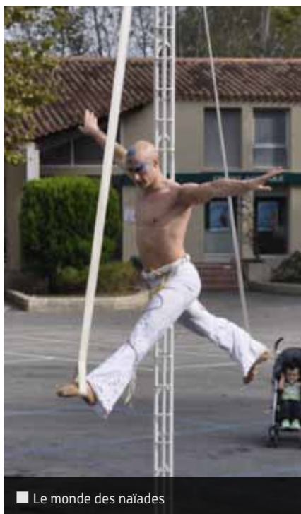
■ Le monde des naïades