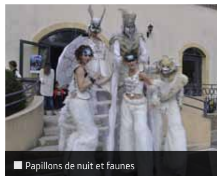
■ Papillons de nuit et faunes