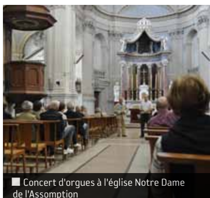
■ Concert d'orgues à l'église Notre Dame de l'Assomption