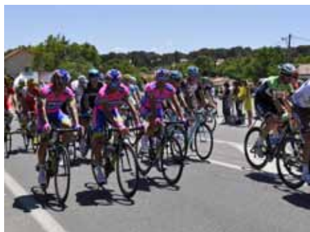
■ 4 juillet - Passage du Tour de France