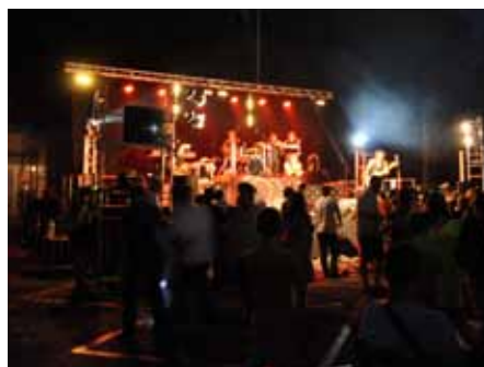
■ 13 juillet - Fête Nationale