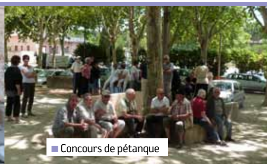
■ Concours de pétanque