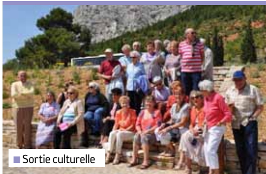
■ Sortie culturelle