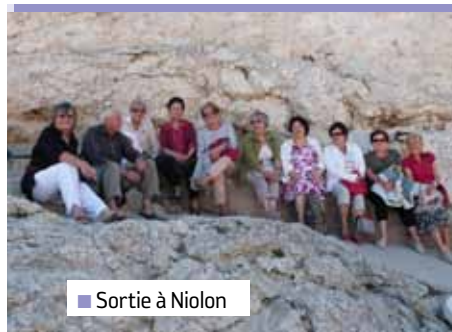
■ Sortie à Niolon