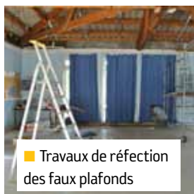
■ Travaux de réfection des faux plafonds

■ École Ventarelle : extension des locaux pour la création d'une cuisine et d'un réfectoire. Les locaux actuels seront aménagés en dortoir, bibliothèque et classe supplémentaire.