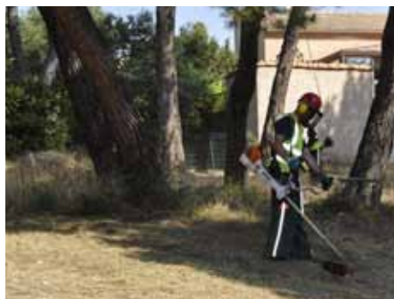
■ 12 juillet - Chantier d'insertion débroussaillage