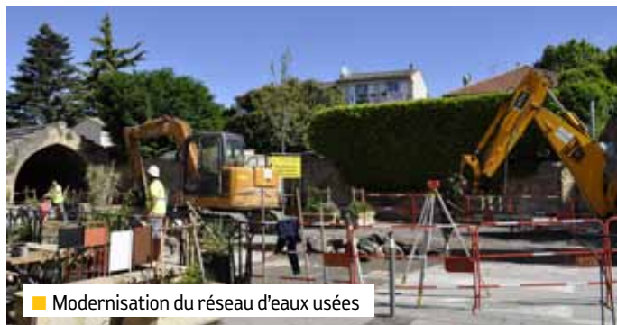
■ Modernisation du réseau d'eaux usées

■ À LA UNE... La commune poursuit son opération de modernisation des réseaux d'eau potable, d'eaux usées, d'éclairage public. Les travaux ont débuté le 15 avril pour une durée d'environ 3 mois entre le carrefour rue de la Résistance - boulevard de la République et le carrefour boulevard de la République - avenue Badonviller. Prochaine étape financée à 100 % par la Communauté du Pays d'Aix : aménagements de l'entrée de ville dès le dernier trimestre 2013.