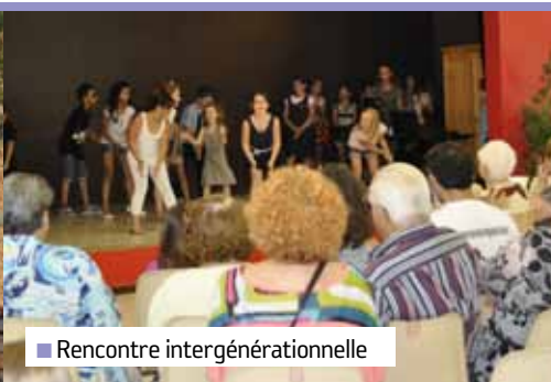
■ Rencontre intergénérationnelle