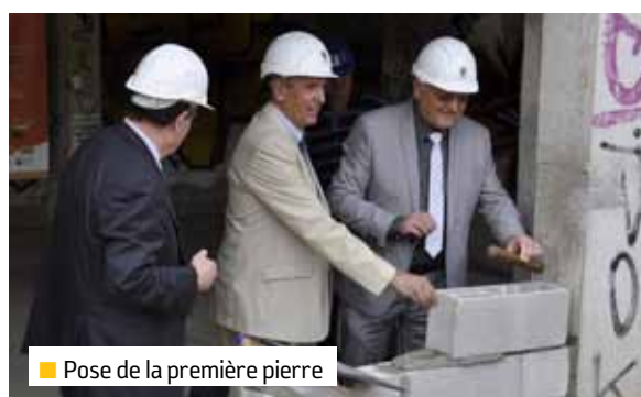
■ Pose de la première pierre