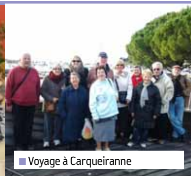
■ Voyage à Carqueiranne