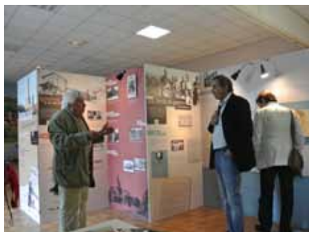
■ 8 juin - Exposition "Lambesc et son canton 1939 - 1945, chronique des années sombres"