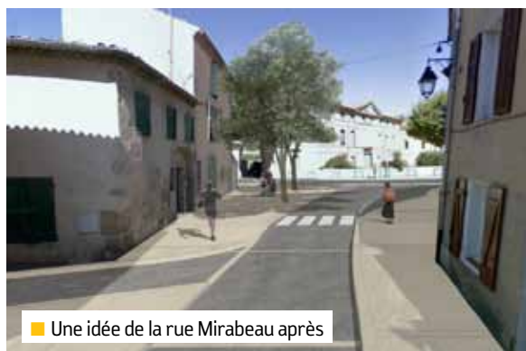
■ Une idée de la rue Mirabeau après