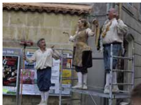
■ 13 juillet - "1789 secondes", Compagnie Internationale Alligator