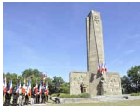
■ 12 juin - Commémoration de l'attaque du maquis de Sainte-Anne