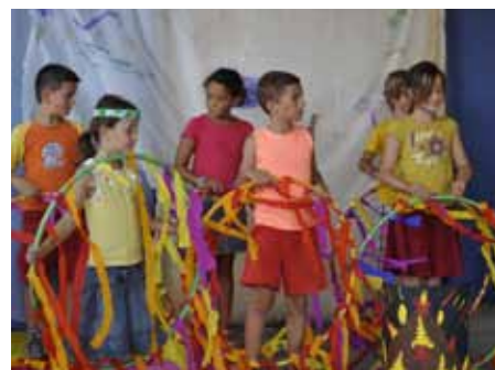
■ 26 juillet - Spectacle de l'accueil de loisirs