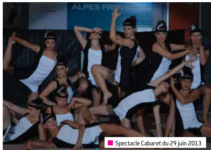
■ Spectacle Cabaret du 29 juin 2013