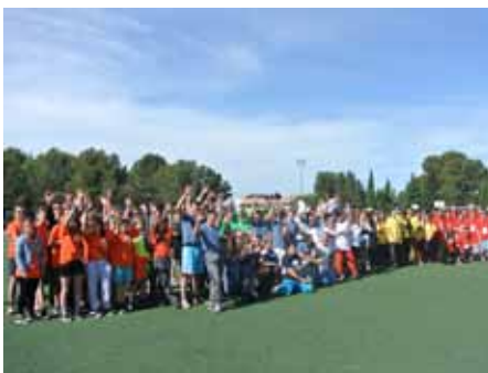
■ 11 juin - Rencontre sportive inter MFR