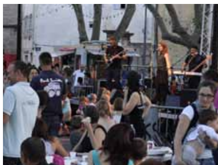
■ 21 juin - Fête de la musique