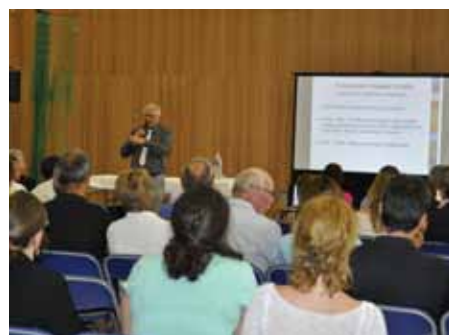
■ 27 juin - Réunion publique : 250 personnes pour découvrir Lambesc qui change