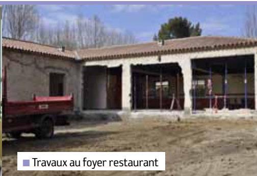
■ Travaux au foyer restaurant