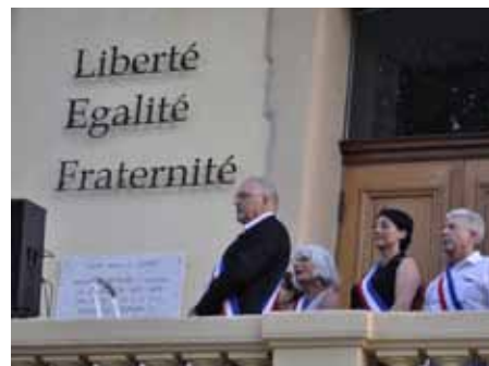
■ 13 juillet - Inauguration du fronton de la Mairie