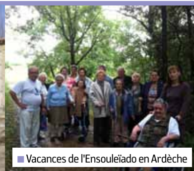
■ Vacances de l'Ensoleiado en Ardèche