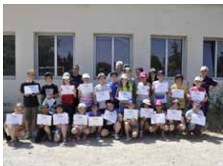
■ 18 juin - Sécurité routière à l'école Jeanne d'Arc