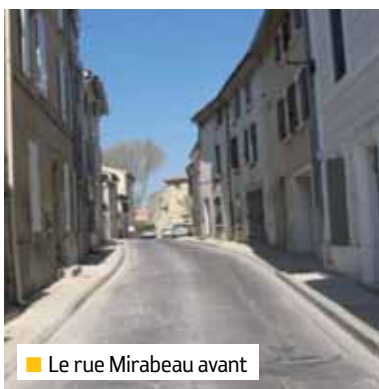
■ Le rue Mirabeau avant

Dans le cadre de la requalification du quartier de la Place des Héros et Martyrs, les travaux seront lancés au troisième trimestre 2013 par la rénovation de la rue Mirabeau : élargissement et mise en sécurité des trottoirs. Les travaux se poursuivront par la place des Héros et Martyrs et le carrefour rue Grande et Gambetta.