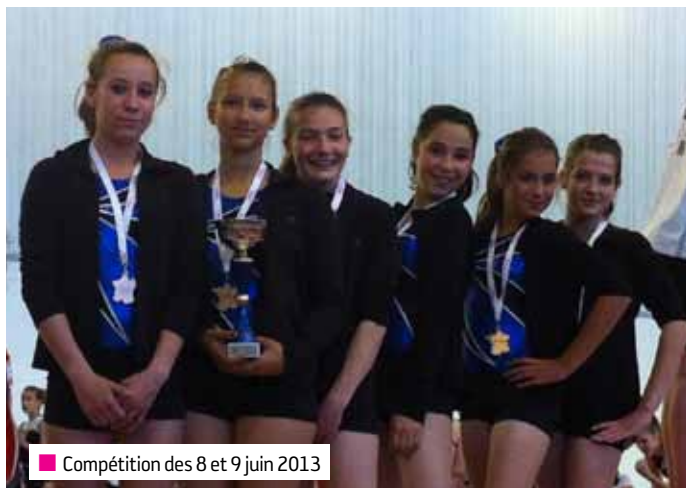
■ Compétition des 8 et 9 juin 2013