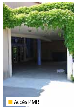
■ Accès PMR