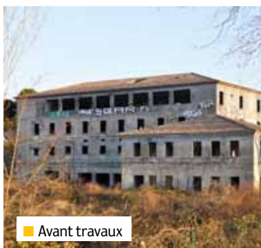
■ Avant travaux

Le jeudi 27 juin dernier, était posée la première pierre du domaine de l'Estagnol. Une étape symbolique qui marque le début des travaux réalisés par Logirem pour la construction de 44 logements BBC du T1 au T5 et avec des loyers compris entre 150 et 786 €.