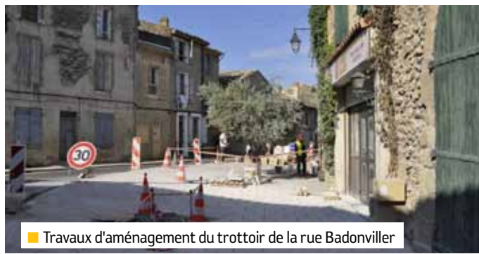
■ Travaux d'aménagement du trottoir de la rue Badonviller