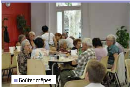
■ Goûter crêpes